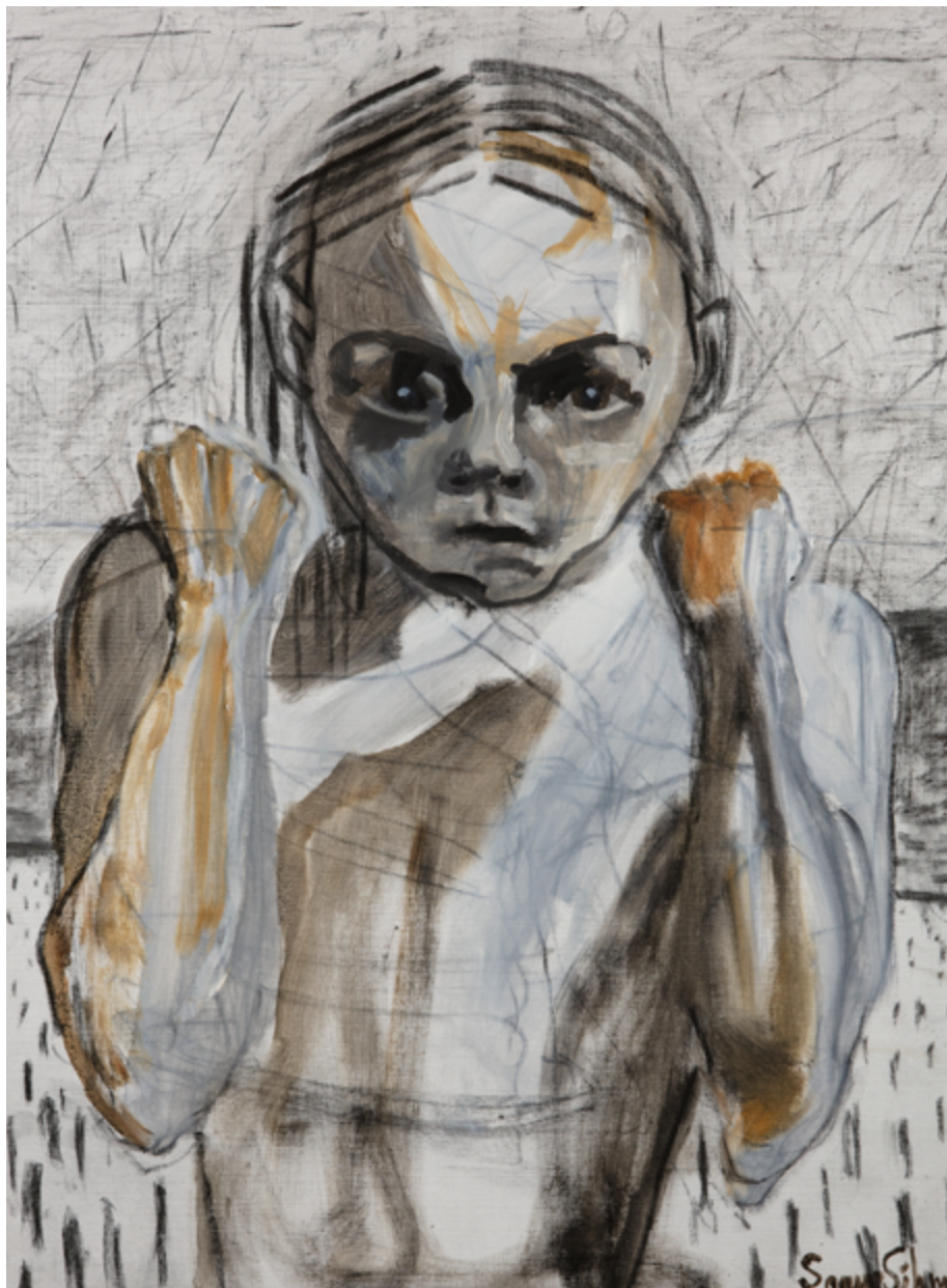
FRAM MED MUSKLERNA – Sanne Sihm, 2018.