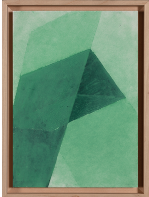
SVIKT NR 9 – Liva Isakson Lundin, 2018.

I oktober 2004 beslutade kommunfullmäktige att Knivsta kommun ska tillämpa enprocentregeln: "en procent av byggkostnaden ska avsättas för konstnärlig utsmyckning vid varje ny- och/eller ombyggnation av kommunens lokaler" 2 . Vidare uppdrog kommunstyrelsen 2006 åt förvaltningen att ta fram rutiner för hur kommunen ska arbeta med konstnärlig utsmyckning. Dessa rutiner blev emellertid aldrig färdigställda. Sedan det första beslutet om enprocentsregeln i Knivsta 2004 har visserligen flera gestaltungsprojekt genomförts men utan övergripande rutiner och långsiktigt helhetstänk.