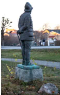
OMSLAGETS BAKSIDA: OLOF THUNMAN, Skulptur av Eric Ståhl.

Dokumenttyp: Program Diarienummer: KS-2017/357 Beslutande nämnd: Kommunstyrelsen Beslutsdatum: 2018-04-23 Giltighetstid: Tillsvidare Dokumentansvarig: Kultur och fritidschef