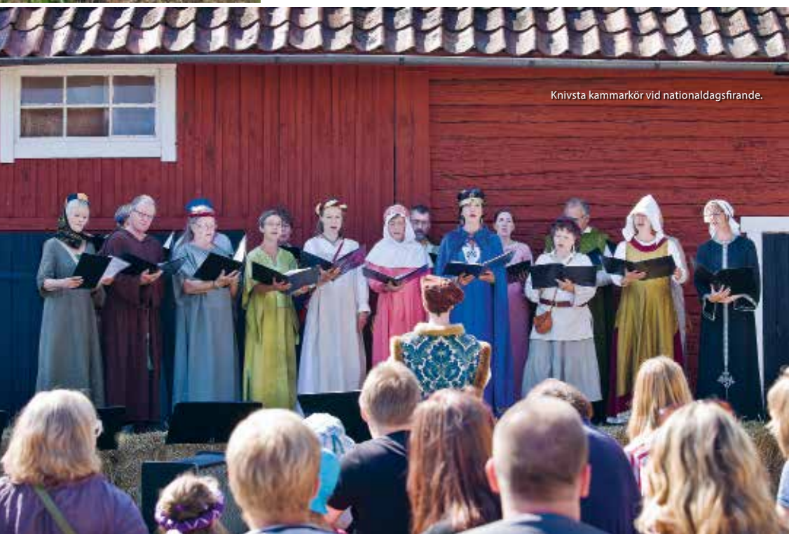
Knivsta kammarkör vid nationaldagsfirande.