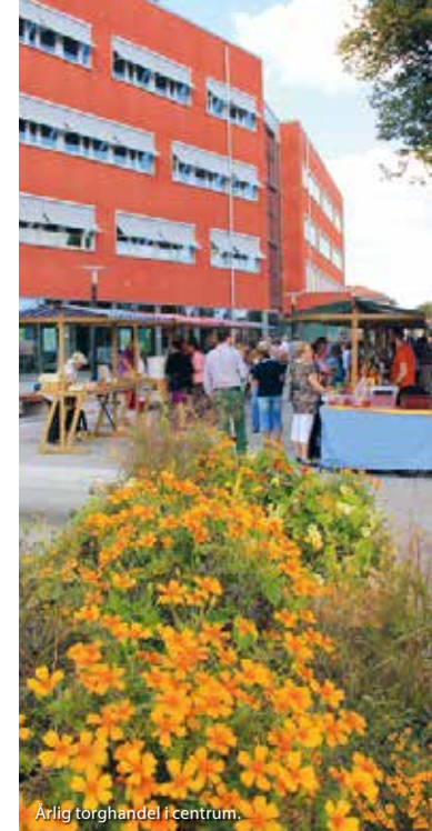
Årlig torghandel i centrum.