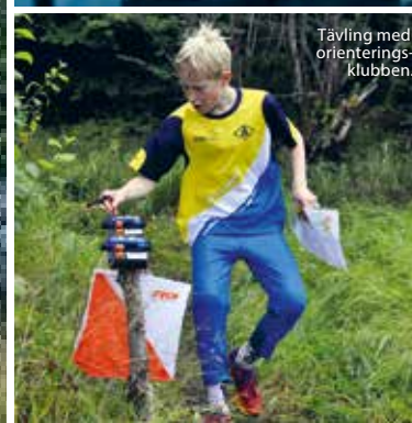
Tävling med orienteringsklubben.