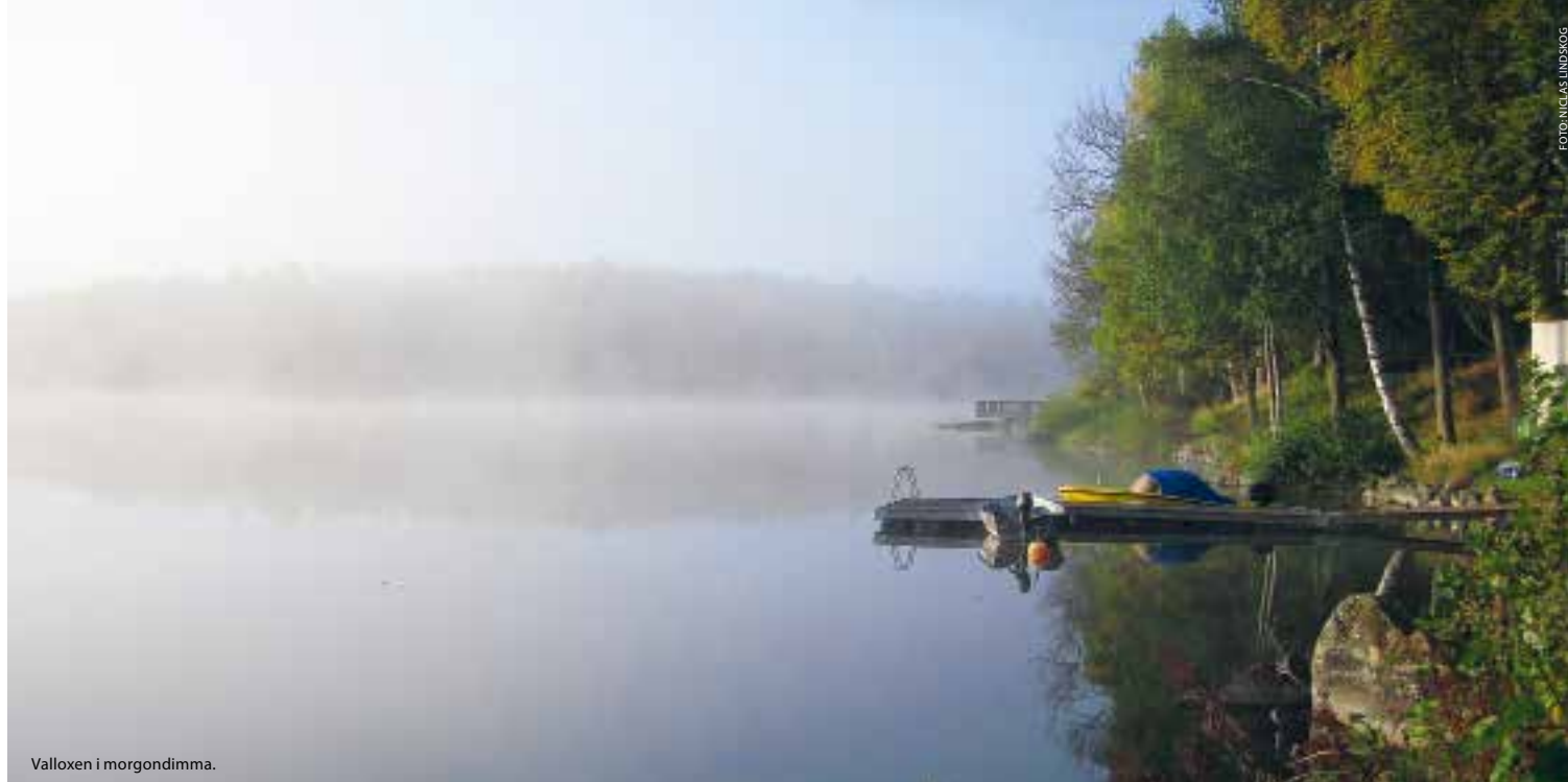
Valloxen i morgondimma.