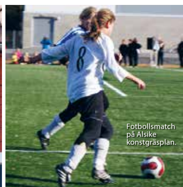
Fotbollsmatch på Alsike konstgräsplan.