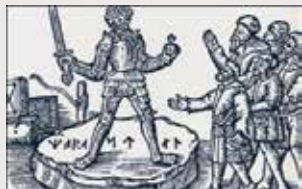
Mora stenar. En fantasifull bild ur Olaus Magnus "Historia om de nordiska folken", utgiven på latin 1555.

Knivstrakten omnämns i dokument från 1200-talet och har ett kommunvapen som pryds av Mora stenar – platsen där medeltidens kungar godkändes och hyllades innan de gav sig ut på Eriksgata. Varje gång det var kungaval ristades en sten, och några av dessa bevaras idag i en museibygnad intill Östunavägen.