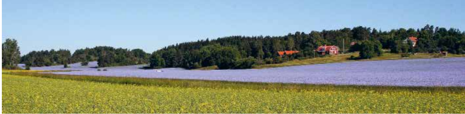
Linfält vid Vassunda. Trakten kring Knivsta är gammal jordbruksbygd.

När friherren Gustaf Cederström på Krusenberg målade sitt stora verk Karl XII:s likfärd använde han sig av såväl landskap som modeller från hembygden. Office-ren med värjan är konstnären själv, den döde konungen en soldat från Skokloster. I bakgrunden sluttar vägen ned mot Hågaån. Gustaf Cederström ligger begravd på Alsike kyrkogård.