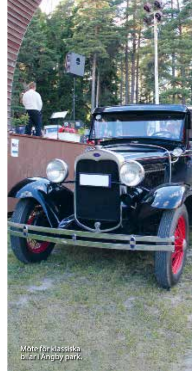
Möte för klassiska bilar i Ängby park.