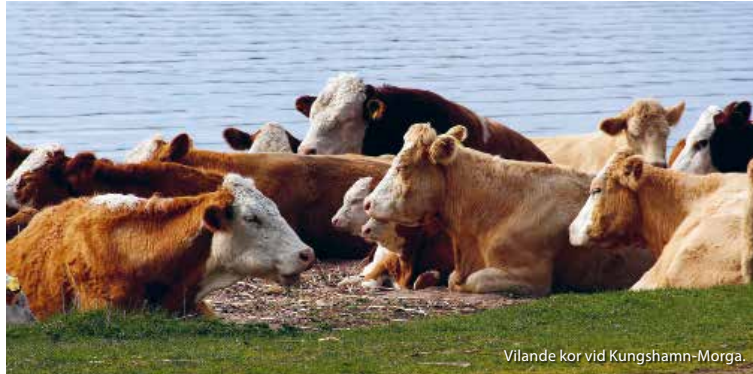
Vilande kor vid Kungshamn-Morga.