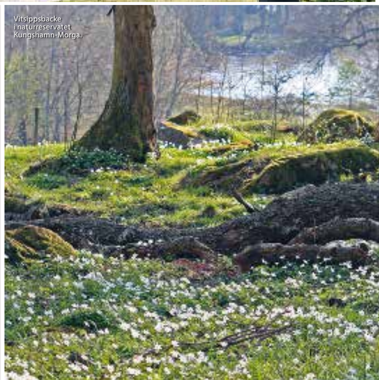
Vitsjppsbacke i naturreservatet Kungshamn-Morga.

Edabadet ligger vid Eda lägergård vid Norrsjön. Här finns badplats och båtbygga, med fina vatten för kanotpaddling.