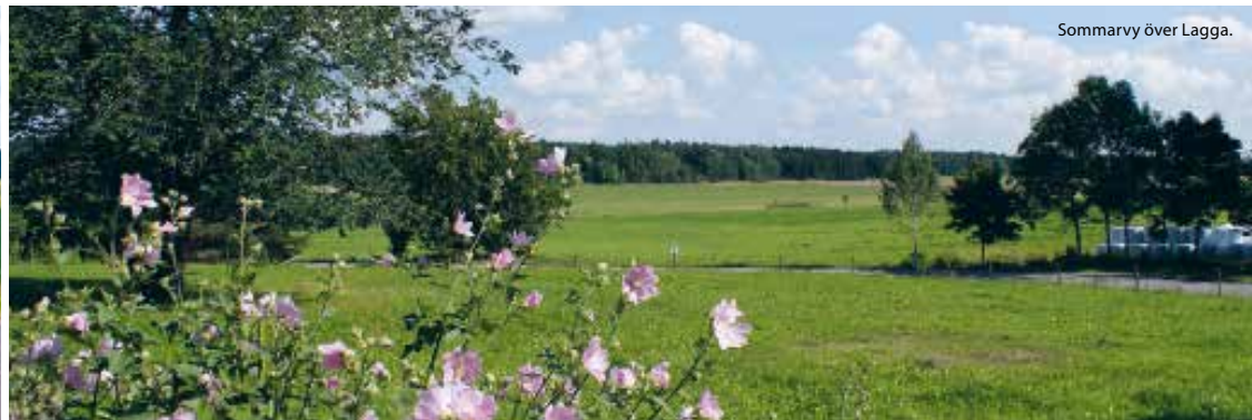
Sommarvy över Lagga.