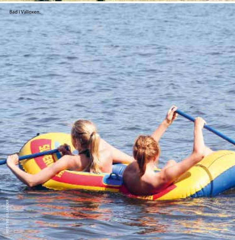
Bad i Valloxen.