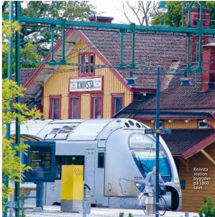
Knivsta station byggdes på 1860-talet.