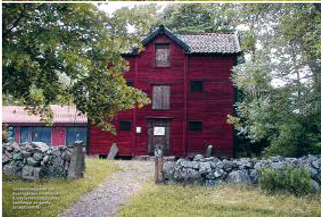
Sockenmagasinet vid Kvarngården innehåller Knivsta Hembygds gilles samlingar av gamla bruksföremål.