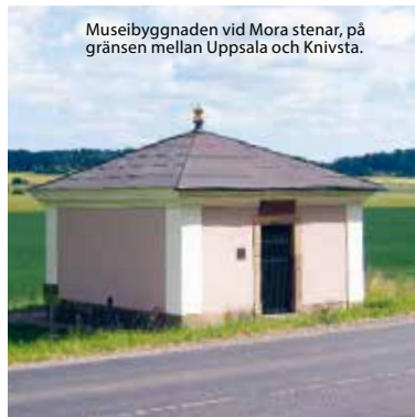
Museibygnaden vid Mora stenar, på gränsen mellan Uppsala och Knivsta.